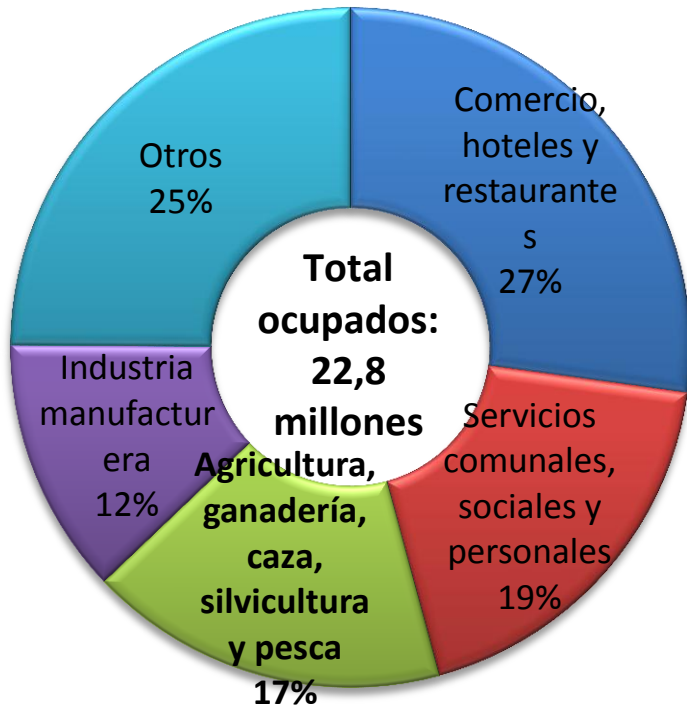
Participación por Ramas en el Empleo 2017

Del total de ocupados en los centros poblados y rural disperso, 64% son Agro.