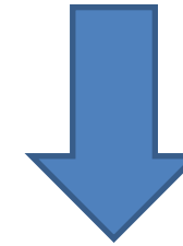
Posición de los ocupados en las áreas rurales

Del total de ocupados en los centros poblados y rural disperso, 64% son Agro.